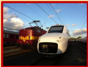
De 1200 in line-up met de Fyra

meegewerkt werd geïnterviewd net als een van de 'stewardessen' die op de TEE werkten. Een van de andere beroemde treinen die bij Werkspoor gebouwd werden was de Trans Europa Expres, het spoorse alternatief voor vliegvluchten. Vandaar dat de conductrices (net als in de luchtvaart) stewardess werden genoemd.