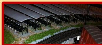
De Fietsenstalling van Werkspoor

De daken van de loodsen zijn klaar, de schoorsteen rookt echt, er staat een mannetje te lassen, de metalen delen die in de openlucht verwerkt worden (Bouw 8) werden in de menie gezet, en... we bouwden een fietsenstalling.