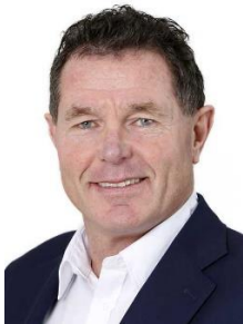
CEO Onno van de Stolpe in Quote500: "Als Filgotinib in 2020 op de markt komt, kan dat een mooi moment zijn om het stokje over te dragen".

In een recent interview met Quote500 gaf Onno mee dat hij ondanks die sterke wens om zelfstandig te blijven de kans dat Galapagos binnen 10 jaar nog steeds zelfstandig zal zijn op minder dan 50% inschat. Hij ziet zichzelf de rol van CEO ook geen vijf jaar of langer invullen: "Als Filgotinib in 2020 op de markt komt, kan dat een mooi moment zijn om het stokje over te dragen". Het is zeker zo ver nog niet, en het is duidelijk dat hij in elk geval voor een naadloze opvolging zal zorgen. Onno ademt Galapagos, het is ook zijn baby.