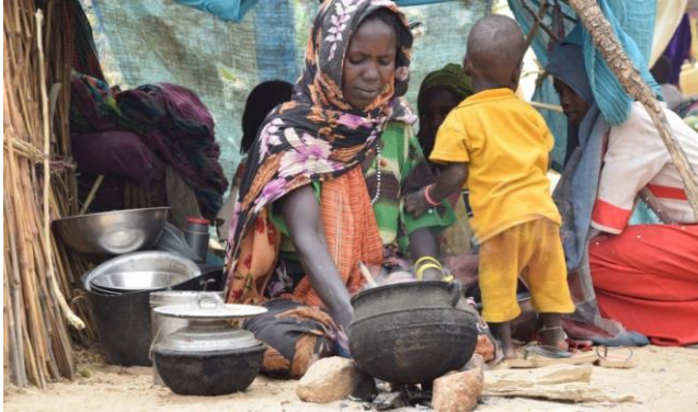
Een Soedanese vluchteling is met landgenoten bij Koufroun de grens met Tsjaad overgestoken, waar ze wacht op voedselhulp.

Terwijl de blik van de wereld veelal gericht is op de gevechten in de Soedanese hoofdstad Khartoem, ontspoord het geweld in de westelijke regio Darfur. Gaat de gruwelijke geschiedenis zich herhalen in dit gebied?