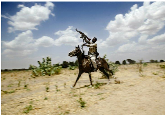
Een strijder van de Janjaweed ('gewapende mannen te paard') in Darfur.

Hoewel de strijders door het Westen werden gezocht wegens oorlogsmisdaden, werden ze door Al-Bashir beloond voor hun deelname aan de genocide. De paramilitairen kregen landbouwgrond, een goudmijn en aandelen in banken. Ook daarna kreeg de RSF alle gelegenheid om verder te groeien. Zo kreeg de militie een belangrijke rol in het tegenhouden van migranten die via Soedan naar Europa wilden en werden duizenden RSF-soldaten naar de frontlinie in Jemen gestuurd om tegen ruime vergoeding te vechten tegen Houthi-rebellen.